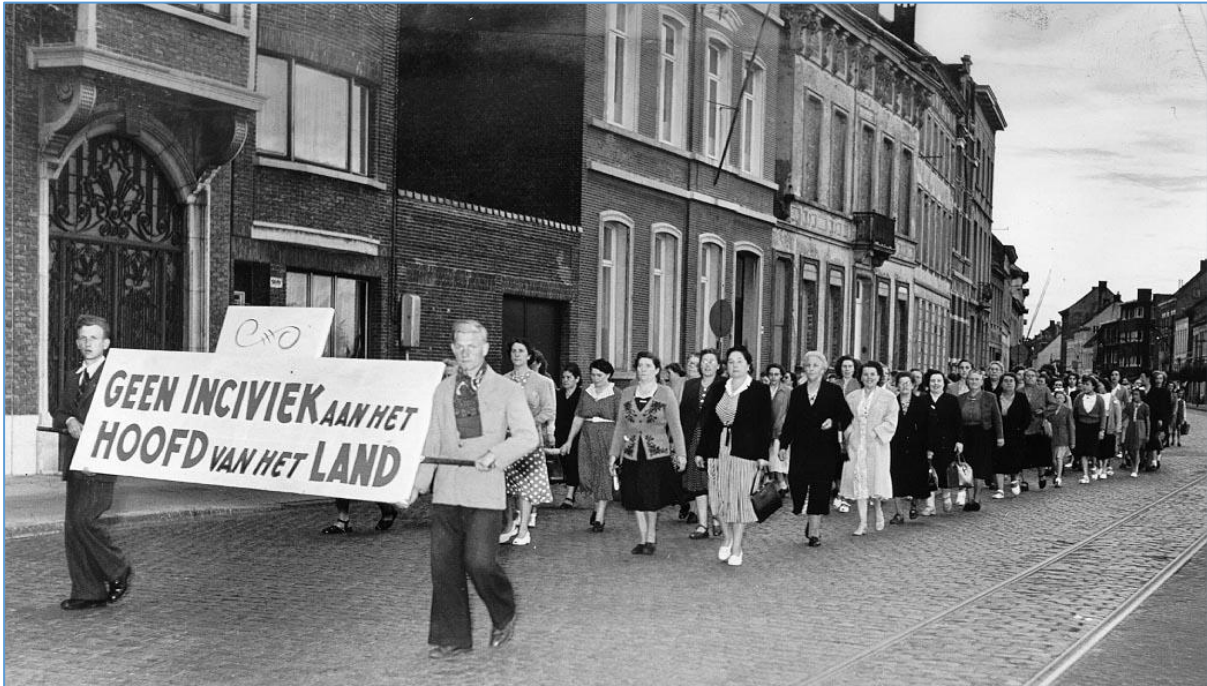
De Koningskwesie verdeelt het land (Amsab)

In de laatste aflevering analyseren een aantal experts de beeldvorming in Vlaanderen over het verzet. Waarom denken wij over het verzet wat we denken? Er zijn zo'n aantal beelden die rond het verzet hangen, die doorheen de jaren dominant zijn geworden. Wie over het verzet spreekt, zal vaak beginnen over de zogenaamde 'septemberweerstanders'. Mensen die op het laatste moment in het verzet zijn gegaan, en zich dan tijdens de straatrepressie te buiten gingen aan wreedheden tegen verdachten van collaboratie. Maar stoelt dat beeld ook op werkelijkheid? En waarom zitten er geen verzetsstrijders in het collectieve geheugen in Vlaanderen?