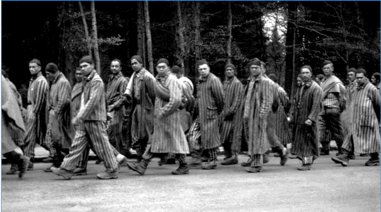
Gevangenen tijdens een dodenmars

September 1944. Het grootste deel van België is bevrijd, maar de oorlog is nog niet voorbij. Tienduizenden Belgen zitten nog vast in Nazi-concentratiekampen in Duitsland. De familie is niet op de hoogte van hun lot. Het is bang afwachten wie terugkomt en wie niet. En wanneer de overlevenden terugkomen, zijn hun verhalen zo gruwelijk dat haast niemand ze gelooft.