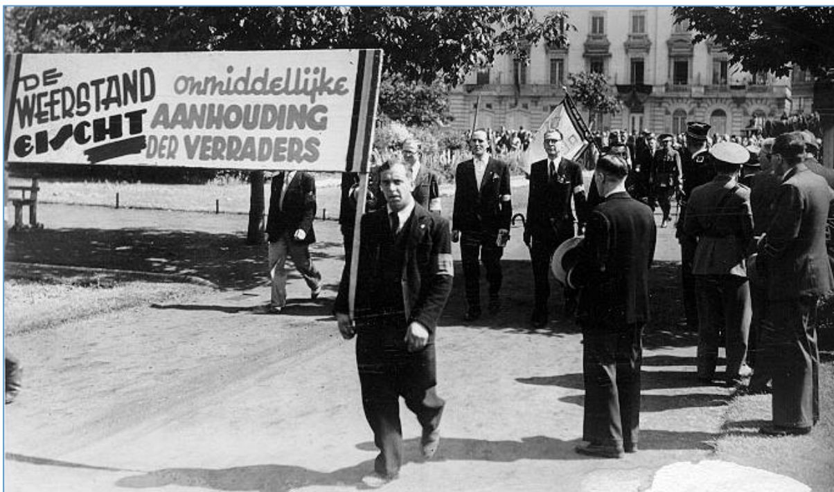
Weerstanders komen op straat (Amsab)

In de jaren vijftig en zestig verenigen oud-verzetslieden zich en proberen ze te wegen op het publieke debat. Ze strijden voor een strenge bestraffing van collaborateurs en erkenning voor hun eigen verzetsdaden. Later verzetten ze zich met man en macht tegen de plannen om amnestie aan collaborateurs te verlenen. Dat die collaborateurs steeds vaker van zich laten horen, valt in verzetskringen niet in goede aarde.