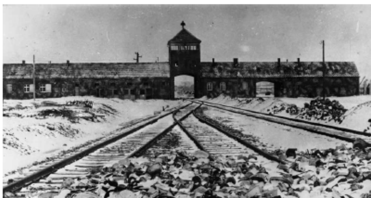
Birkenau, 1941